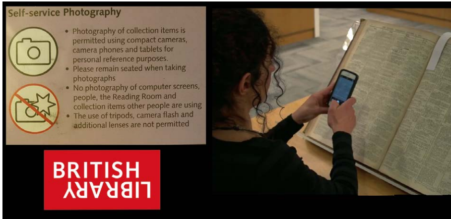
Fig. 1. La riproduzione con mezzo proprio nelle sale studio. Fotogramma tratto dal video tutorial diffuso in rete dalla British Library: < http://www.bl.uk/reshelp/inrooms/stp/copy/selfsrvcopy/book_photography_video.mp4 >.